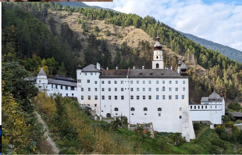
ABBAZIA MONTE MARIA