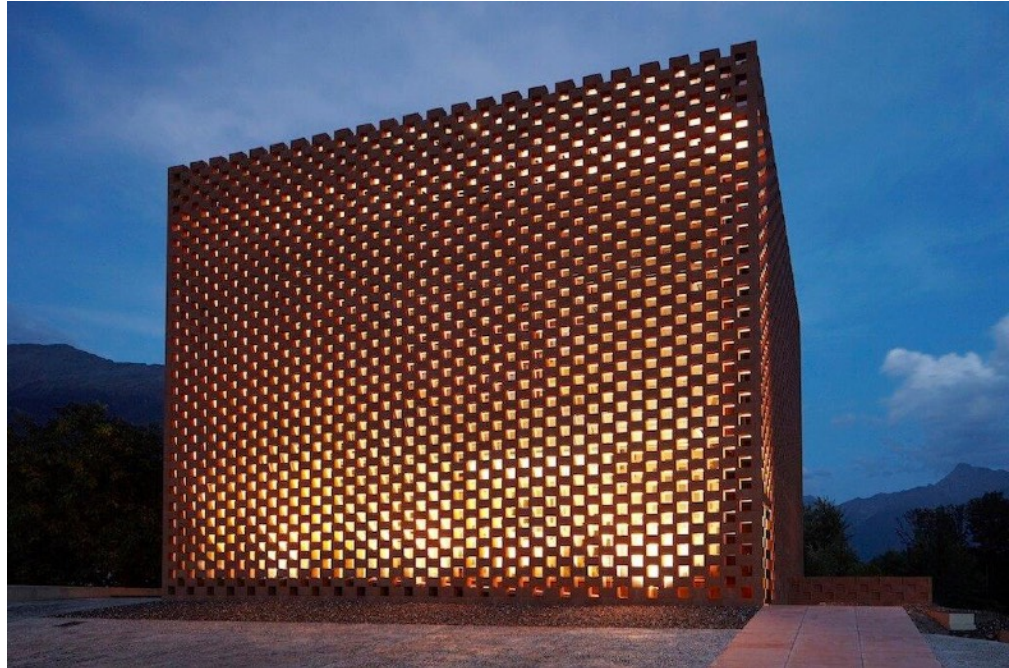
WISKEY DISTILLERY IN GLORENZA