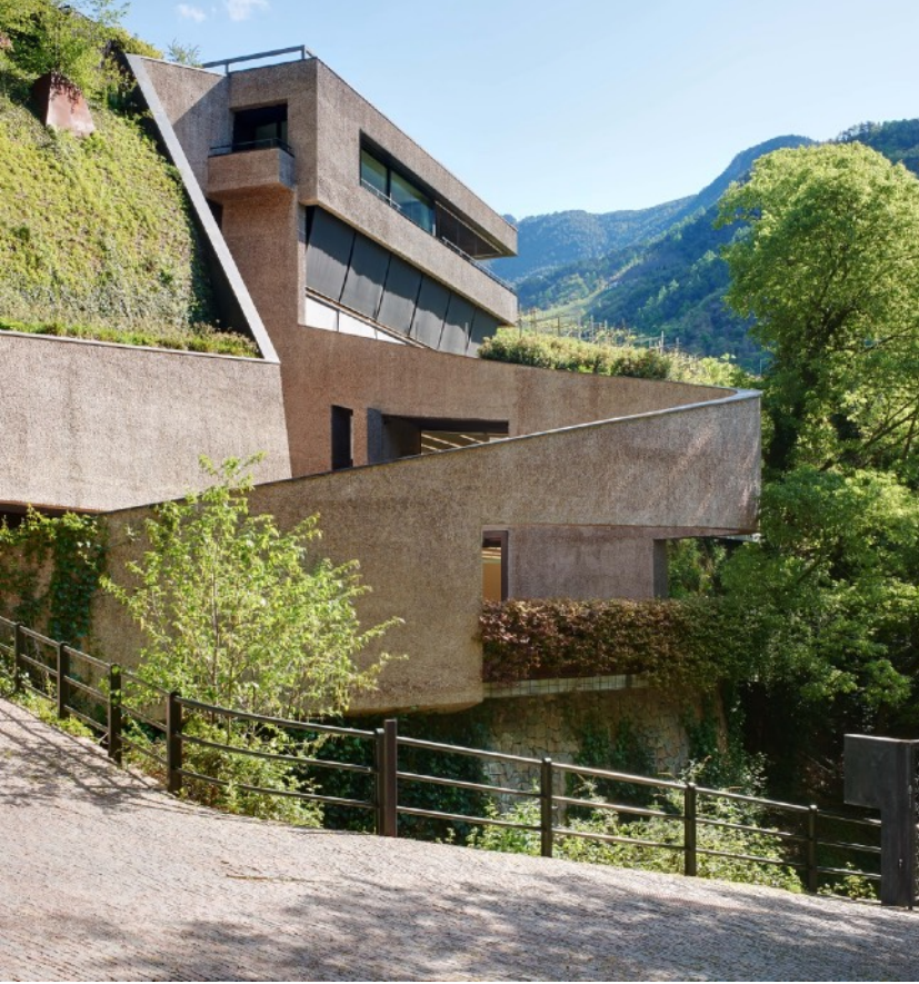
FONDAZIONE DALLE NOGARE